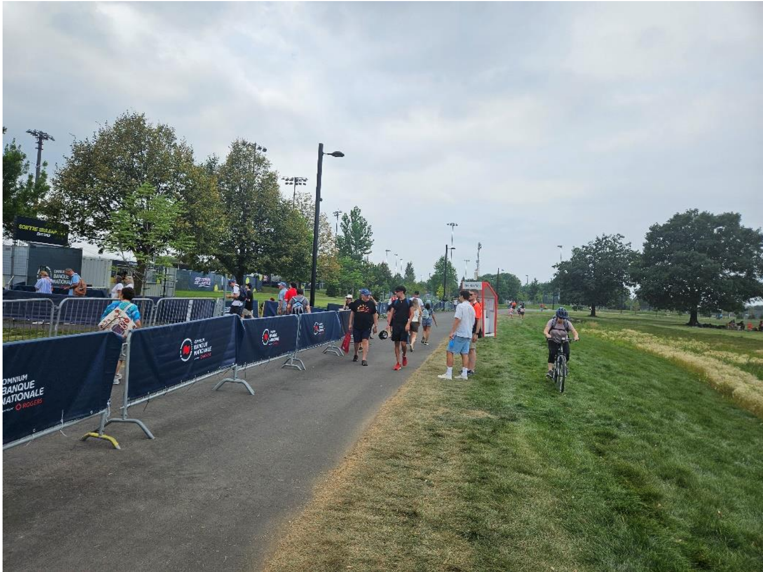
Un kiosque d'information installé dans l'anneau central constituait un obstacle additionnel.