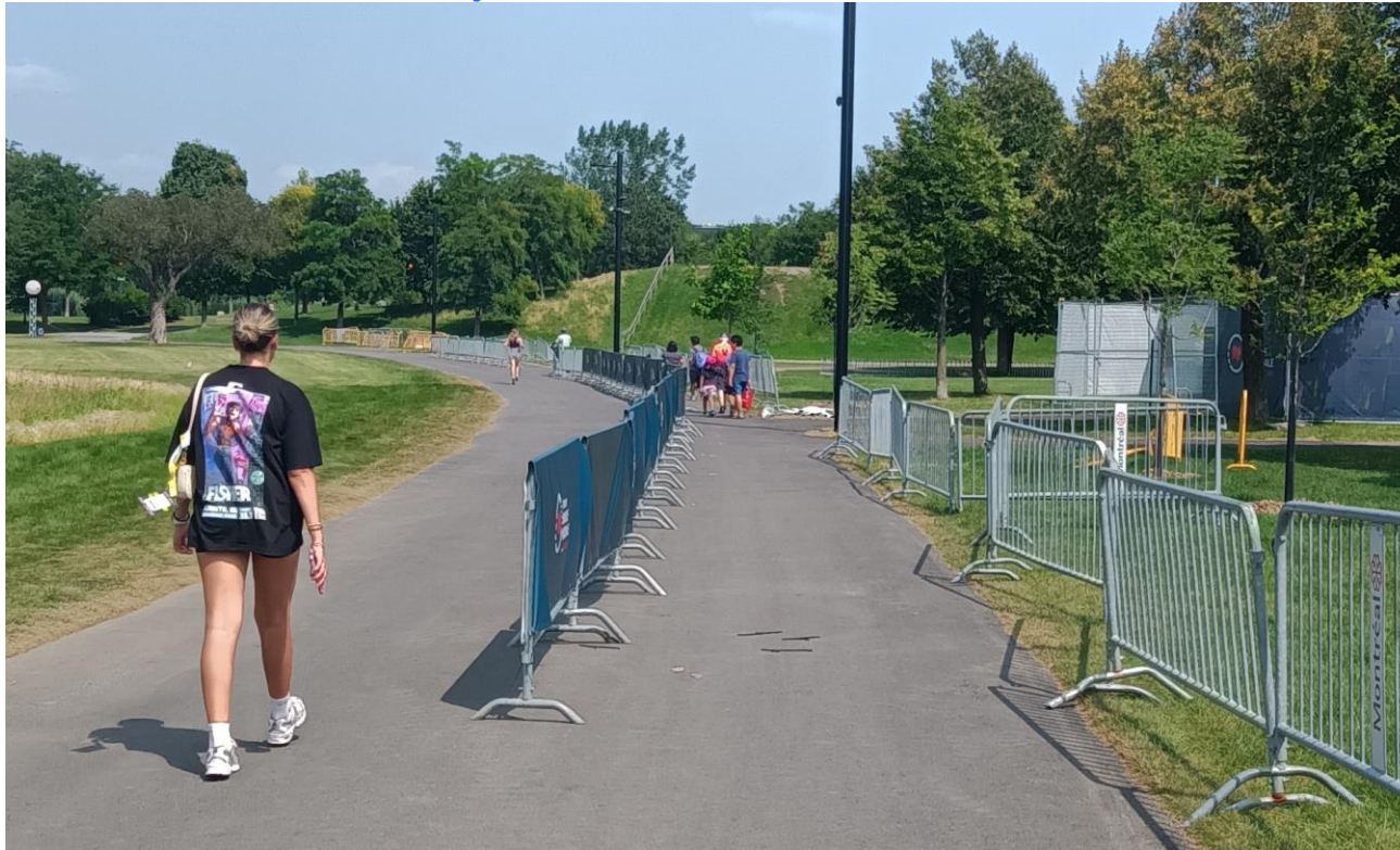
Un jour avant le début du tournoi